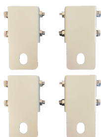
BS-SBA001WMA Kit fissaggio a muro