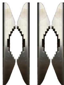
BS-SBA001PMA Kit fissaggio a palo