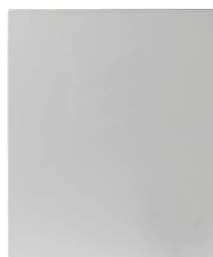
BS-SBA001GB Base da pavimento BS-SBA001GBI Base da pavimento acciaio Inox 316