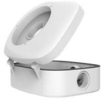
BS-JB4505 Box di giunzione